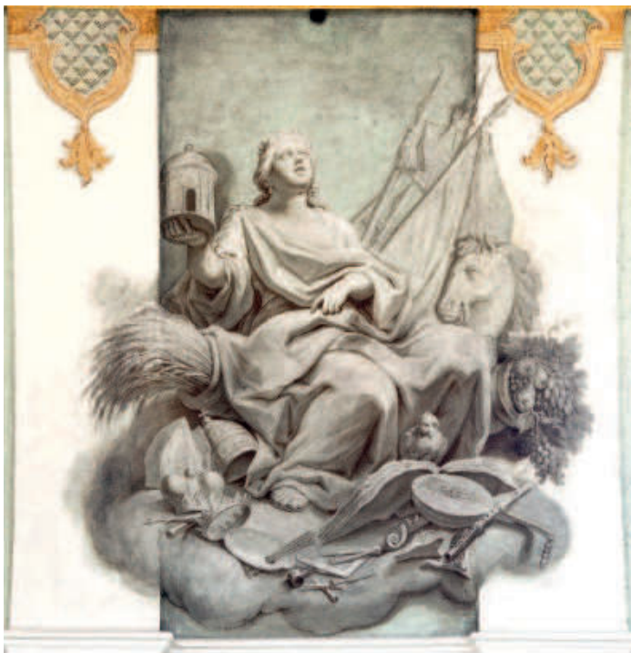
Abb. Seite 23

Martin Knoller, personifizierte Darstellung Europas, 1772